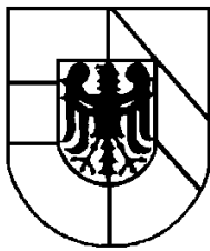
Landkreis Breisgau Hochschwarzwald